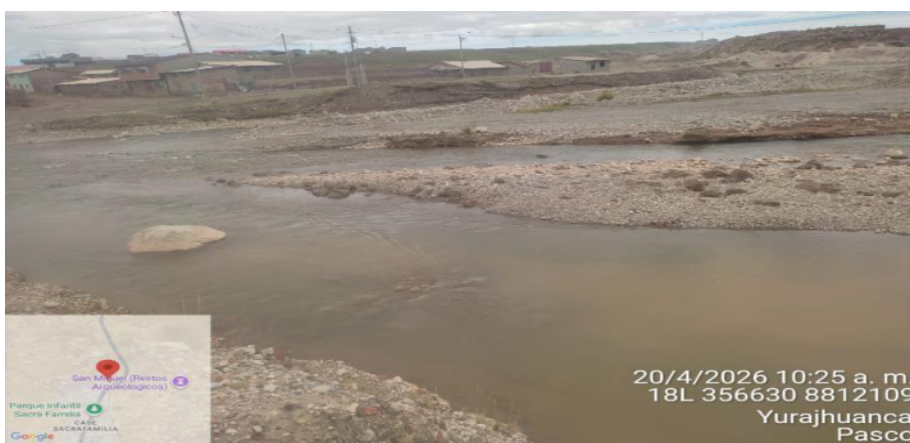
FIGURA N°04: SE VISUALIZA EN LA PARTE FINAL DEL TRAMO ANTE UNA AVENIDA QUE HAY POBLACION VULNERABLE EN EL SECTOR SACRAFAMILIA