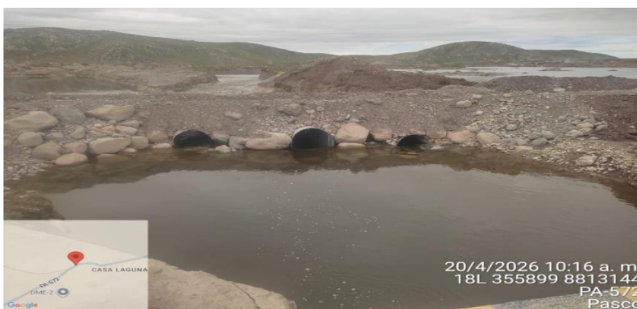
FIGURA N°03: EL PUENTE ESTA INTRANSITABLE POR LO QUE SE HA OPTADO POR UN PASE TEMPORAL CON ALCANTARILLAS SE OBSERVA AGUAS ABAJO LAS MARGENES EROSIONADA