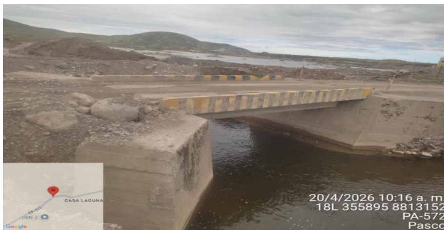
FIGURA N°02: EL CAUDAL EROSIONA LOS MUROS QUE SOPORTAN LA CAPA DE RODADURA DEL PUENTE SE OBSERVA EL MURO INCLINADO REQUIERIENDO DE LIMPIEZA Y DESCOLMATACION AGUAS ABAJO