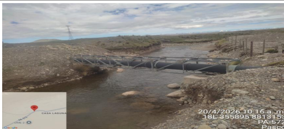
FIGURA N°01: INICIO DEL TRAMO CRÍTICO SE MUESTRA TUBERIA DE RELAVES MINEROS QUE PUEDEN CONTAMINAR EL TIO HUARAUPAMPA QUE ES UN AFLUENTE AL RIO SAN JUAN SE MUESTRA COLMATADO EN LA PARTE ALTA